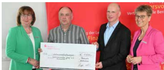
Unterstützt wurde unter anderem der Schützenverein „Greif“ e. V. Blumenthal – und zwar von der Sparkassenstiftung und den Stadtwerken Torgelow.