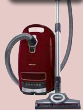
Akku- und Bodenstaubsauger