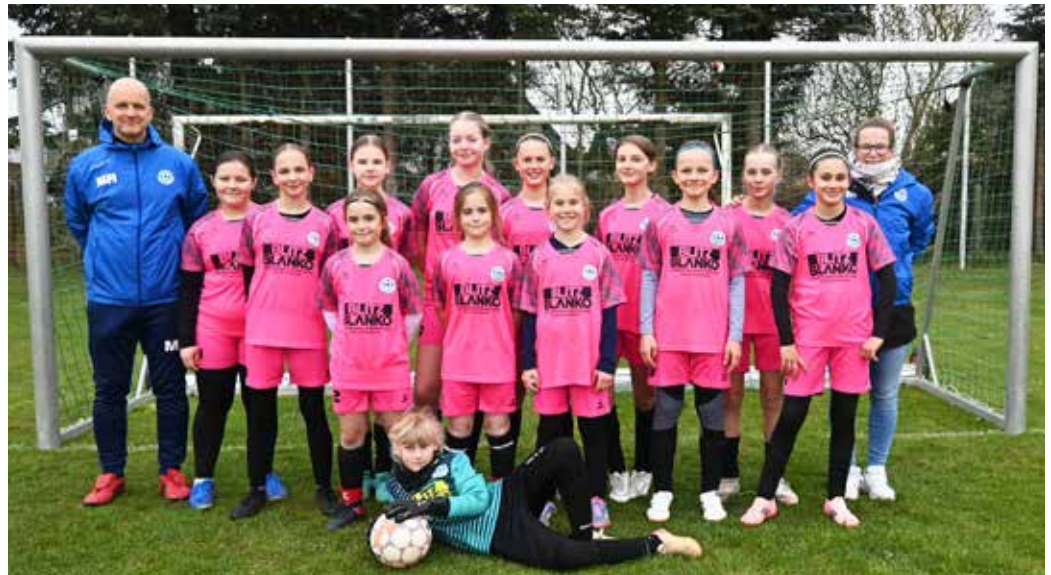
Dieses junge Team des Luckower FC 2024 e. V. tritt am 17. Mai im Ueckermünder Waldstadion im Palmberg-Landespokal gegen Hansa Rostock an.

Der bisher größte Vereinsfolg ist nun der Einzug ins Finale des Palmberg-Landespokals der Mädchen. Am 17. Mai 2026 treffen die D-Juniorinnen (Jahrgang 2013 und jünger) im Waldstadion Ueckermünde auf den FC Hansa